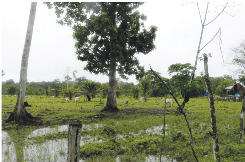
داوین: تراژدی جنگل. اینجا مثلاً جنگل بارانی است، نفوذناپذیر و پر از موجودات نادر. حالا درخت‌ها از بین رفته‌اند و گاوها در زمین می‌چرند.