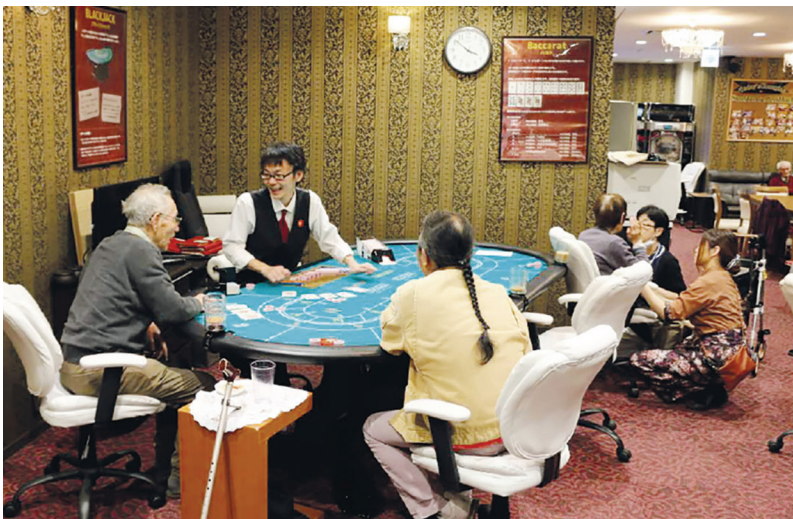
یکی از میزهای بازی مرکز پرستاری روزانه لاس‌وگاس.