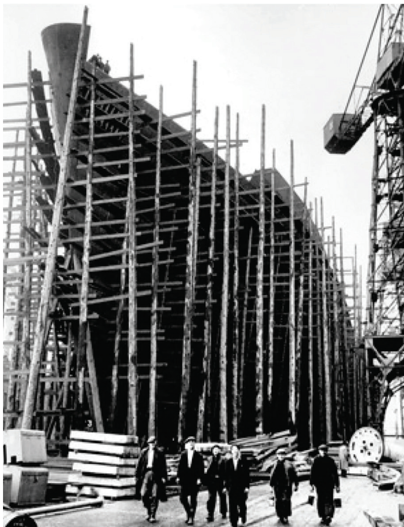
مردان در حال خروج از کارخانه کشتی سازی فریلد.