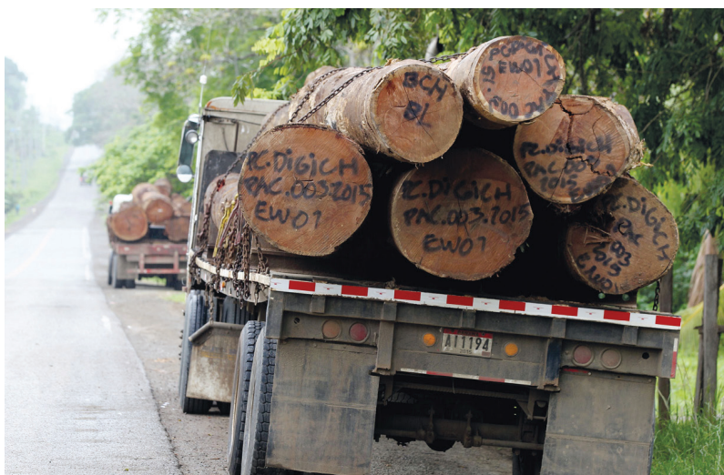
کامیون‌های حمل چوب در بزرگراه پان‌امریکن.