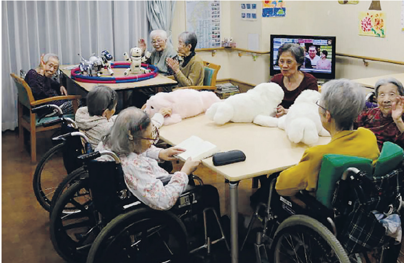
آکیتا: خداحافظی با بیماران مرکز پزشکی بال‌های نقره‌ای که در آن درمان با استفاده از روبات‌های درمانی صورت می‌گیرد.