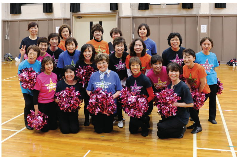
آکیتا: زاپنی‌ها معنای پیری را به چالش کشیده‌اند. این تشویقچی‌ها بین ۷۰ تا ۹۰ سال سن دارند.