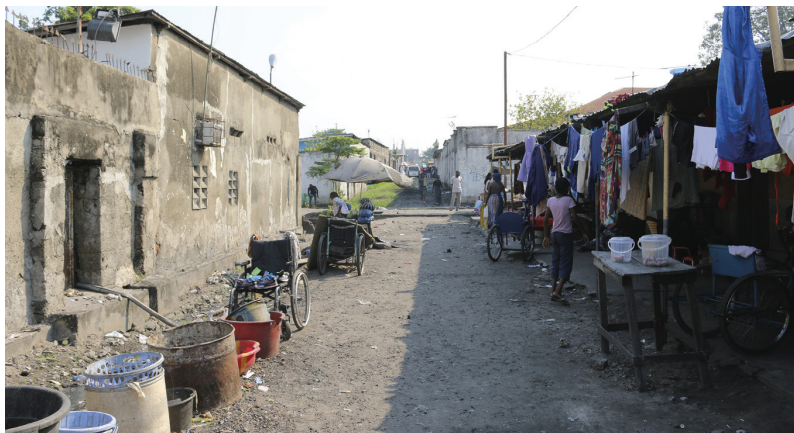
خیابانی فرعی که ساکنان آن برای امرار معاش زغال سنگ تقسیم می‌کنند. تورم و فساد کمر آن‌ها را شکسته است.