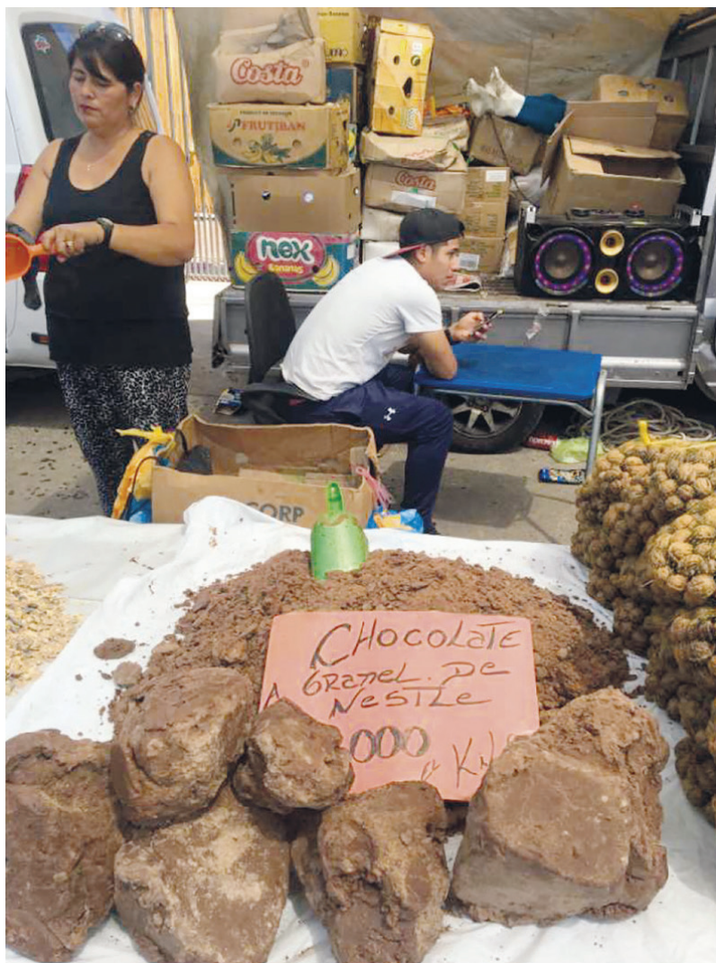
بازار کارساز. شکلات ارزان قیمت در محله ای فقیرنشین