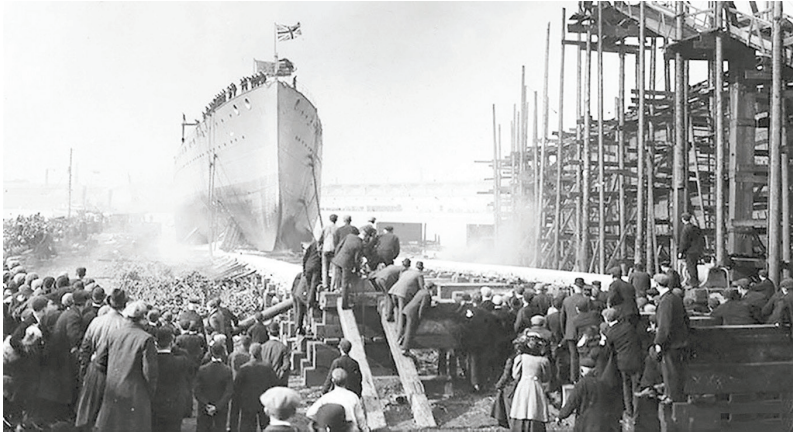
محلی‌ها در حال تماشای راه‌اندازی کشتی «ایندامیتبل»، مارس ۱۹۰۷.